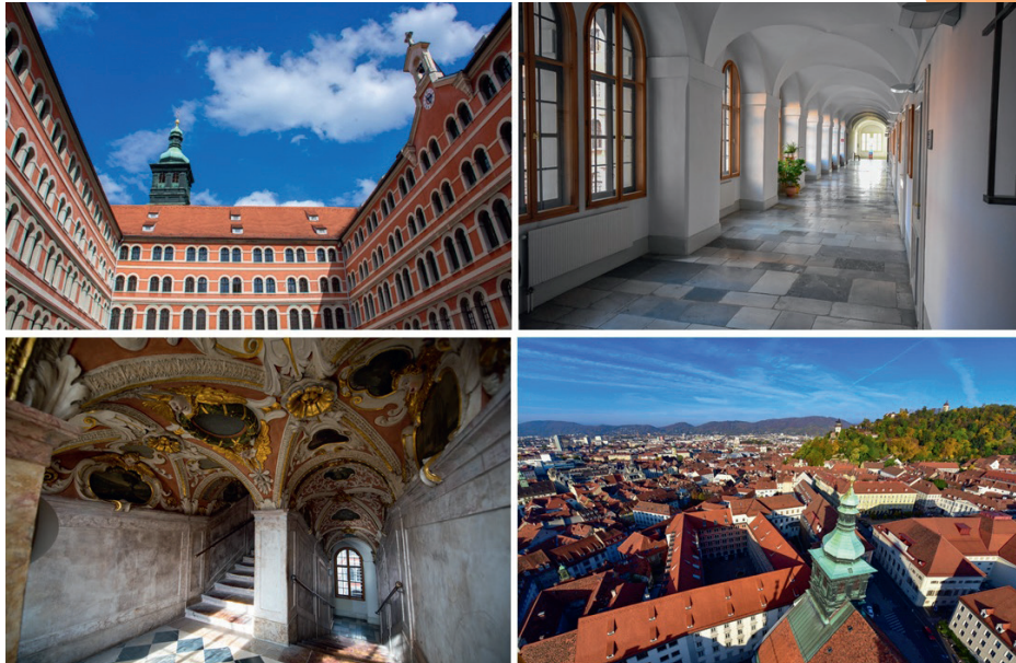
Priesterseminar Graz